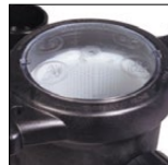
Couvercle de préfiltre transparent