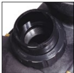
Raccords unions facilitant l'installation et la maintenance