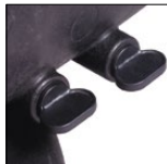
Bouchons de vidange facilitant l'hivernage