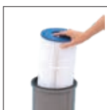
Elemento filtrante facile da rimuovere