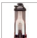
Filtre découpé Star Clear™