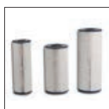
Cartouches de remplacement