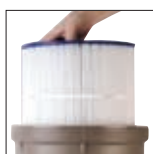
Facile à nettoyer