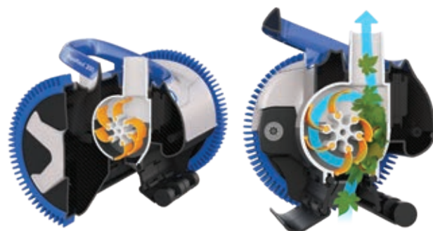
Tecnologia brevettata V-Flex®: turbina a pale mobili per l'aspirazione di detriti grandi